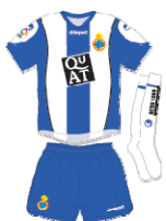
Футболка Еспаньол сезону 2006-2007