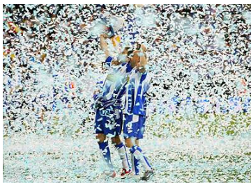
Святкування кубку 2006

Першим кубком, збутиим RCD Еспаньол, був Кубок Макайя у 1901, це ж було й першим успіхом клубу. У 1929 команда здобула свій перший Кубок Іспанії, вона знову отримала цей титул у 1940, 2000 та у 2006.