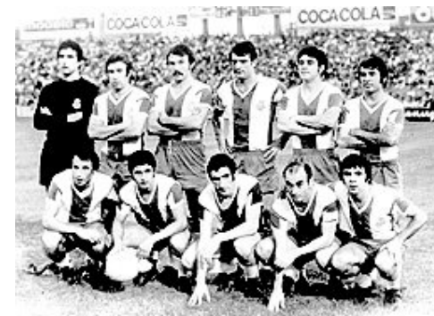
Команда, яку кожен справжній вболівальник знає серцем