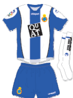
Divisa dell' Espanyol, stagione 2006-2007