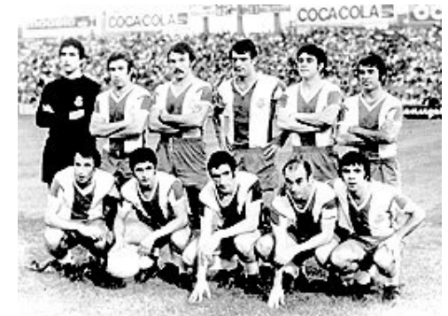
Un equipo que todos los grandes aficionados conocen de memoria