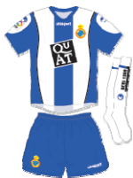
Equipación del Espanyol en la temporada 2006-2007