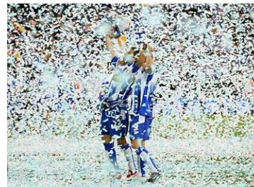
Celebración de la Copa del Rey 2006

La primera copa ganada por el RCD Espanyol fue la copa Macaya, en 1901, que significó el primer éxito del club. En 1929, ganó su primera Copa de España (actualmente Copa del Rey), título que ganó otra vez en 1940, en el año 2000 y en el 2006.