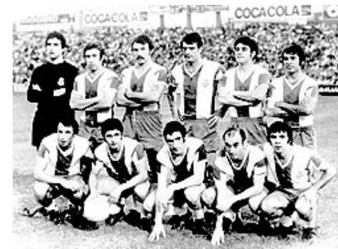
Un equip que tots els grans aficionats coneixen de memòria