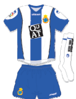
Equipació de l' Espanyol en la temporada 2006-2007