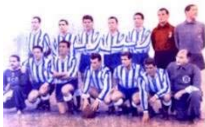
Samarreta de l'Espanyol el 1952