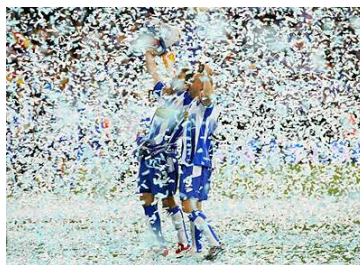
Celebració de la Copa del Rei 2006

La primera Copa guanyada pel RCD Espanyol va ser la copa Macaya, el 1901, que va significar el primer èxit del club. El 1929, va guanyar la seva primera Copa d'Espanya (actualment Copa del Rei), títol que va guanyar una altra vegada el 1940, l'any 2000 i recentment el 2006.