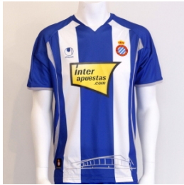
2009-10 sezonu Espanyol Forması