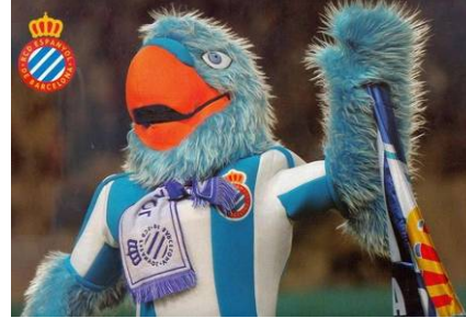
Maskotumuz 'El Periquito'

Zamanla bu sevimli ve herkes tarafından beğenilen kuş 'El periquito' klübün değişilmez maskotu ve simgesi olmuş durumdadır ve taraftarlara kendisini sevdirmiştir