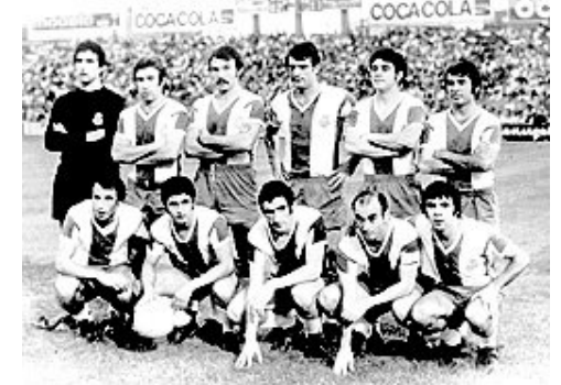
Tüm taraftarların hafızasında yer eden unutulmaz takım

Yüz yılı aşkın bir tarihe sahip olan RCD Espanyol dünyaca meşhur oyuncuları kadrosunda bulundurdu. Belki de ilk ve en önemli idol oyuncu kaleci Ricardo Zamora olmuştur. Zamora'nın ardından akıllara gelen diğer oyuncular ise Marañón (2007 temmuz ayına kadar klüp tarihinin en golcü ismi), N'Kono, Lauridsen ve Pochettino olarak sıralanabilir.