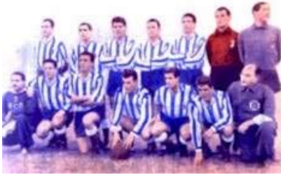
1952 yılı Espanyol Forması