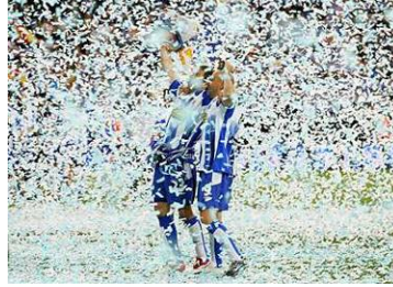
2006 Kral Kupası Zaferi Kutlamaları

RCD Espanyol tarafından kazanılan ilk başarı 1901'de alınan Macaya Kupası'ydı. Klüp 1929 yılında tarihinin ilk İspanya Kupası'nı (Şimdiki adı ile Kral Kupası) müzesine götürdü. Daha sonra aynı kupayı 1940, 2000 ve 2006 yıllarında tekrar kazanma başarısını gösterdi.